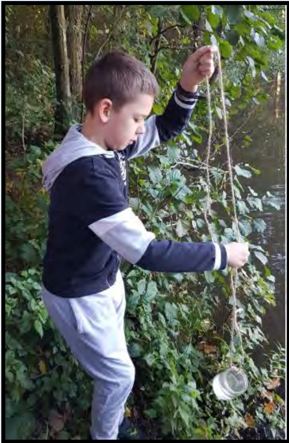
Pobieranie próbki wody